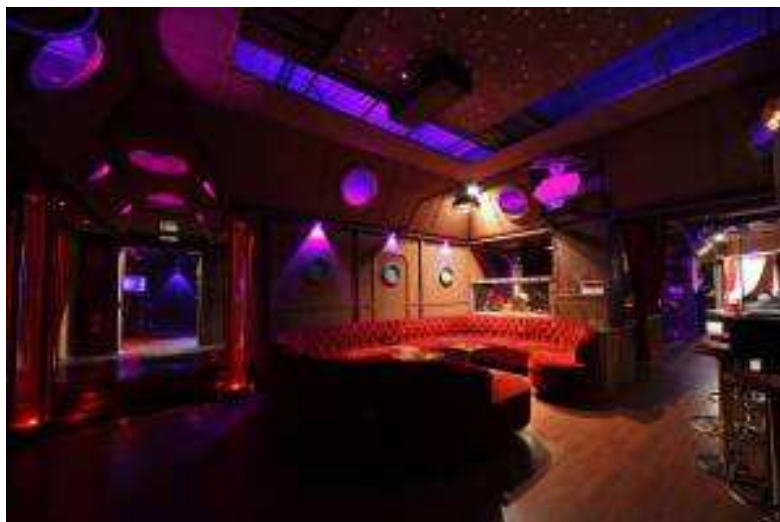
El Club Nautilus de Milán

También hay muchas tiendas y eventos ocasionales: un buen punto de partida para conocerlos sería la lista de enlaces de mi propia web, o la mayoría de listas milanesas publicadas en la web www.secretfetishparty.com .