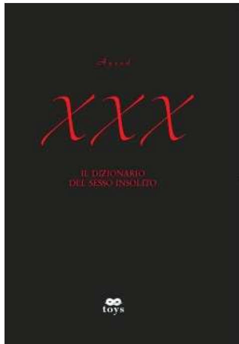
Portada del libro “XXX”

También he publicado algunos artículos divulgativos y algún relato de ficción erótica. El último es sobre toda la basura de hace 20 años, pero de todas formas, puedes encontrar todos mis escritos online en mi web personal. Si conoces italiano, te sugiero bajarte el PDF que tiene extractos de mis libros y una historia larga titulada Per quanto lo faresti? Que es mas reciente y ganó un premio literario en el 2009.