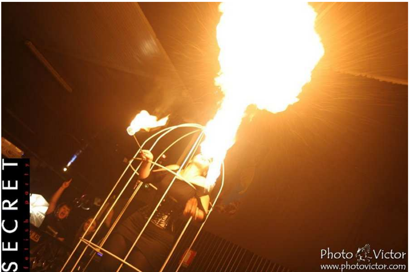
Las cosas se ponen calientes en el "SECRET Fetish Party"

¿Cuándo vendréis vosotros y vuestros lectores?