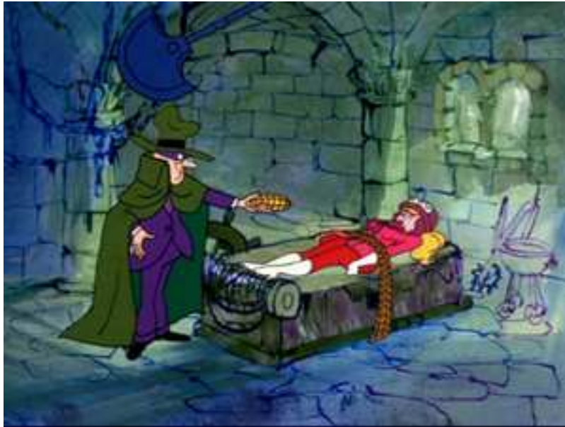
Fotograma de “Los peligros de Penélope”. ¿Veis la hoja oscilante?

Y finalmente... si, cuando era pequeño estaba más fascinado de lo que era aconsejable por una serie de dibujos de Hannah-Barbera llamada Los peligros de Penélope . Cada episodio trataba sobre los increíbles artilugios de tortura que su malvado tío construía para someterla y tener acceso a su fortuna... ¡imagina Gwendoline para niños! No es de extrañar que esta serie desapareciera de nuestras pantallas, ¿verdad?